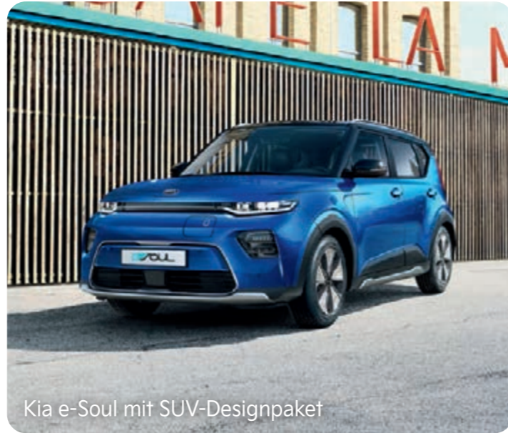
Kia e-Soul mit SUV-Designpaket