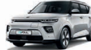
Sparklingsilber Metallic (KCS)