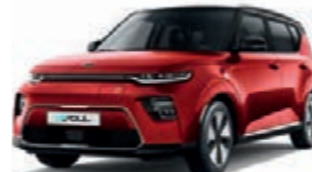
Infernorot Metallic mit schwarzem Dach (AH4)