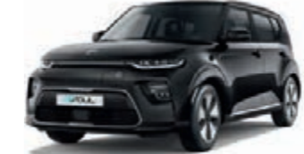
Cassisschwarz Metallic (9H)