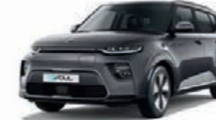
Gravitygrau Metallic (KDG)