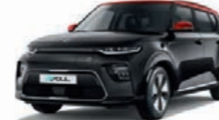
Cassisschwarz Metallic mit rotem Dach (AH5)