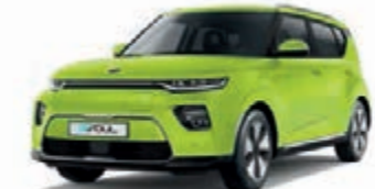
Space Cadet Green (CEJ)