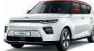
Schneeweiß mit rotem Dach (AH1)