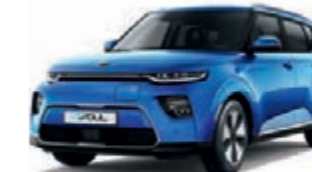
Neptunblau Metallic (B3A)