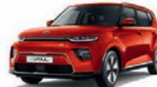
Marsorange Metallic (M3R)