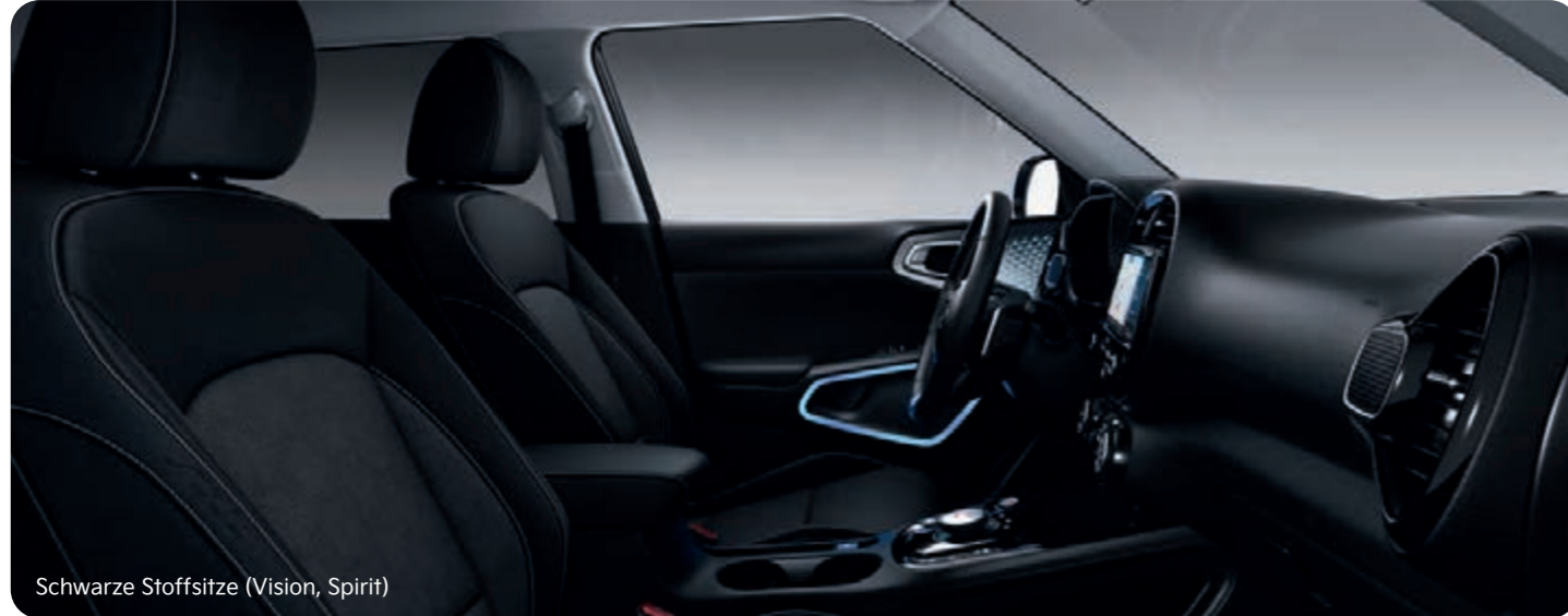
Schwarze Stoffsitze (Vision, Spirit)

Das Qualitäts-Interieur des Kia e-Soul präsentiert sich mit sorgfältig ausgewählten Materialien. Für die Sitze stehen schwarze Bezüge in Stoff und Leder zur Wahl.