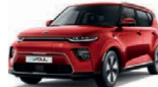
Infernorot Metallic (AJR)