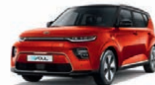
Marsorange Metallic mit schwarzem Dach (SE3)