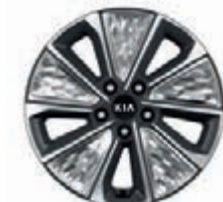
17-Zoll-Leichtmetallfelgen mit Bereifung 215/55 R17

Bei einigen unserer modernen Metallicfarben werden bewusst unterschiedliche Farbpigmente verwendet. Dadurch können unter bestimmten Lichtverhältnissen, z.B. direktes Sonnenlicht, attraktive Farbeffekte erzielt werden. Zum Teil kann die Farbe changieren, z.B. von Schwarz zu Dunkelblau. Bei den hier abgebildeten Farbdarstellungen kann es aufgrund der Drucktechnik zu Abweichungen zu den Originalfarben kommen. Weitere Informationen zu den Farbeffekten und Grundfarben gibt Ihnen gerne Ihr Kia-Vertragshändler. Metalliclackierungen sind aufpreispflichtig.