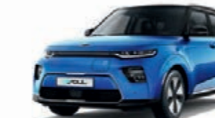
Neptunblau Metallic mit schwarzem Dach (SE2)