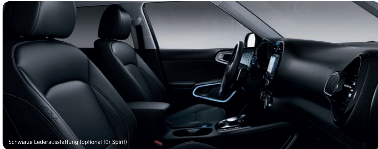
Schwarze Lederausstattung (optional für Spirit)

Ohne Abbildung: schwarze Stoffsitze (Edition 7)